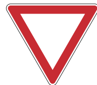
Zeichen 205 „Vorfahrt gewähren“