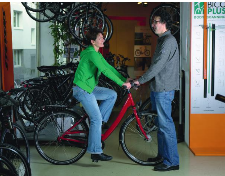
Abb. 10: Anpassung der Sitzposition

Der Sattel sollte ungefähr waagrecht oder mit leichter Neigung der Spitze nach oben eingestellt werden. Hier ist eine bequeme Position individuell auszuprobieren.