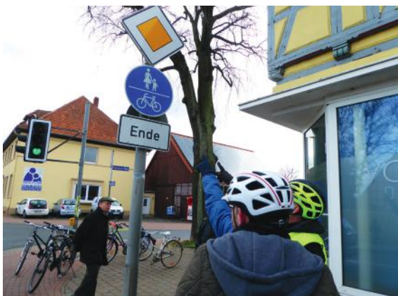
Abb. 30-31: Erprobungsfahrt im Realverkehr