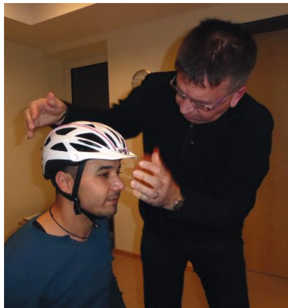
Abb. 07-08: Anpassung des Fahrradhelms und Erklärung des Verschlusssystems