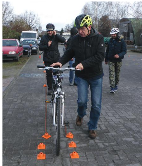
Abb. 18-19: Pedalstellung zum Anfahren und Demo der Übungen durch Vorschieben