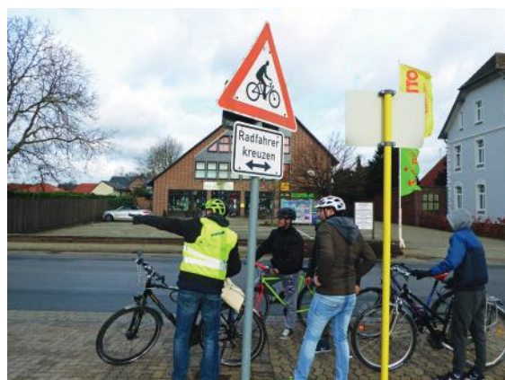
Abb. 26-27: Erprobungsfahrt im Realverkehr