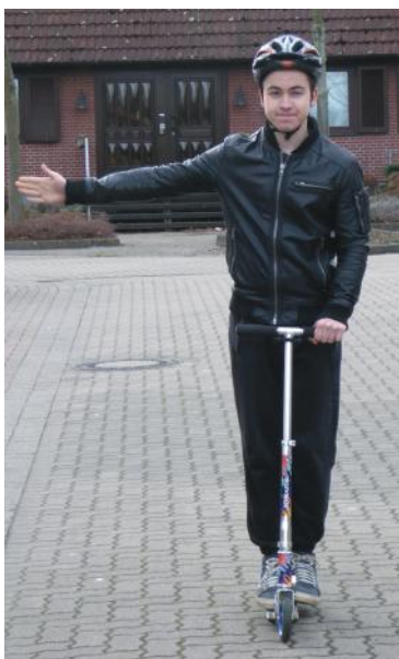
Abb. 15: Handzeichen geben mit Tretroller

Wenn die Übung soweit klappt, sollen sie immer wieder für kurze Zeit den zum Abstoßen verwendeten Fuß auf das Trittbrett stellen. Die Teilnehmenden sollen nach und nach die Zeit verlängern, in der sich beide Füße auf dem Trittbrett befinden.