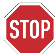
Zeichen 206 „Halt!“