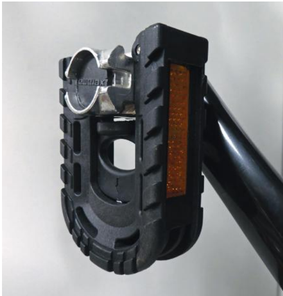
Abb. 16: Klapppedale

Ein Übungsaufbau ist für die folgenden Schritte nicht erforderlich.