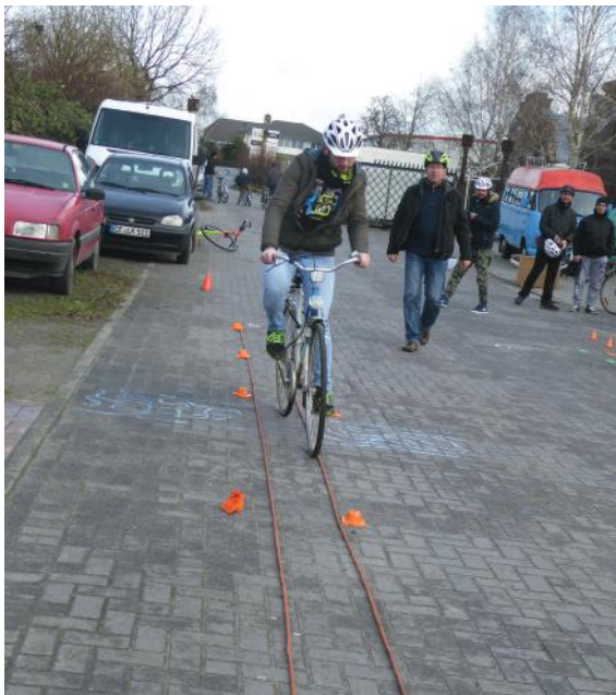
Abb. 20-21: Geradeaus fahren in Spurgasse (Blick zu kurz)