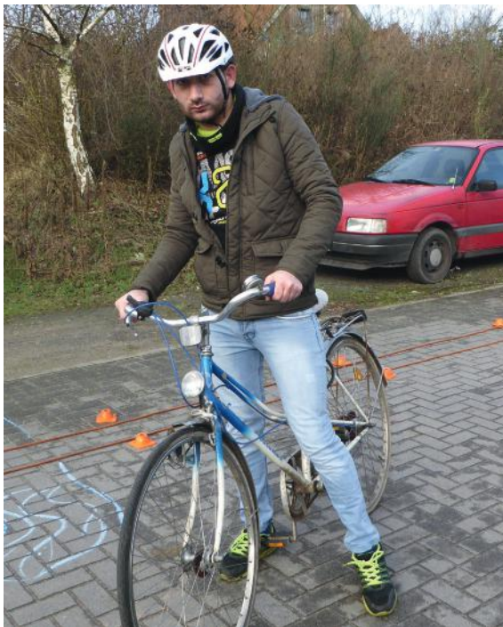
Abb. 12-13: Schwenken des Fahrrades im Stand

Achten Sie darauf, dass die Teilnehmenden bei diesen Übungen den Blick nach vorn richten und nicht vor sich auf den Boden, auf ihre Füße oder auf den Lenker des Fahrrades schauen. Im Bereich der fahrpraktischen Trainingsprogramme für Auto und Motorrad nimmt das Thema Blickverhalten großen Raum ein. Auch beim Fahrradfahren ist es so, dass wir dorthin fahren wohin wir blicken. Wir folgen unserem Blick wie an einem unsichtbaren Band. Starren wir auf das Hindernis, so werden wir es treffen. Selbst bei diesen Übungen ist das Blickverhalten wichtig. Die Teilnehmenden sollen nach vorn schauen, sich voraus z.B. auf dem Übungsplatz eine Art visuellen Ankerpunkt in Verlängerung der Fahrlinie suchen. Erklären Sie, dass genau das damit gemeint ist, wenn Sie in der Folge die kurze Instruktion „Blick weit nach vorn“ geben. Achten Sie darauf und korrigieren Sie immer wieder die Blickführung.