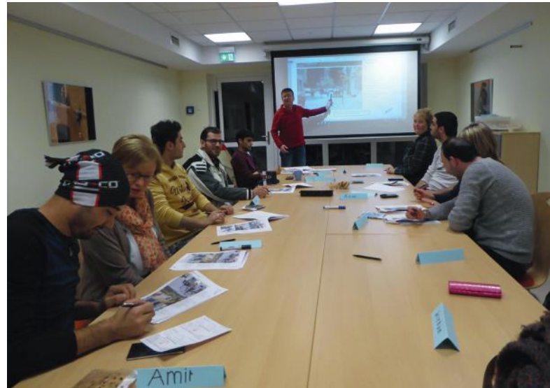
Abb. 09: Verkehrsquiz

Die Teilnehmenden sollen nach Diskussion und Auflösung der einzelnen Fragen in die Kästchen rechts auf dem Arbeitsblatt die Anzahl ihrer richtigen Antworten eintragen. Wenn bei den Arbeitsblättern 13-14 mehrere Antworten richtig waren, dann auch mehrere Punkte. Wenn alle Fragen der Arbeitsblätter 9-14 korrekt beantwortet wären, so ergibt dies 35 richtige Antworten. Nennen Sie diese Zahl, ohne jedoch die Punktzahl von der Gruppe abzufragen. Sagen Sie, dass es eine sehr gute Leistung ist, wenn ein Punktwert von 23 oder mehr erreicht wurde. Wenn nicht, ist es auch nicht schlimm sondern verdeutlicht nur einen weiteren Lernbedarf. Ermuntern Sie die Teilnehmenden, ihre Kenntnisse unter Zuhilfenahme der Arbeitsblätter weiter zu vertiefen und immer wieder einen Abgleich mit ihrem Verkehrsumfeld vorzunehmen – im Sinne ihrer eigenen Sicherheit.