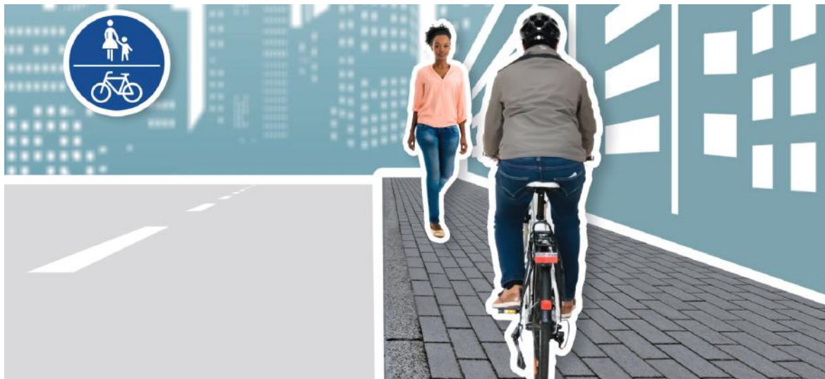
Abb. 06: Visualisierung mittels der Smartphone-App German-Road-Safety