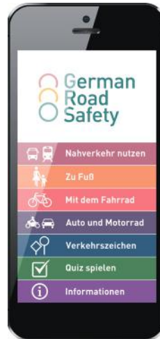
Abb. 02: Smartphone-App „German Road Safety“

Bei den Arbeitsblättern 1-6 handelt es sich um eine Übersicht der wichtigsten und grundlegendsten Regeln und Schilder für Radfahrende. Wenn Sie die Notwendigkeit einer Ergänzung sehen, z.B. weil es in der Nähe Örtlichkeiten und Straßen mit besonderer Ausschilderung und/oder schwieriger Vorfahrtsregelung gibt, so sprechen Sie dies an. Vielleicht haben die Teilnehmenden auch konkrete Fragen zu anderen Verkehrsschildern oder Verkehrsregelungen. Visualisieren Sie die entsprechenden Schilder und Situationen über Flipchart, Overhead-Projektor oder Beamer. Vielleicht haben Sie Zugriff auf magnetische Verkehrszeichen und Fahrzeuge, die an einem metallenen Whiteboard auf selbst gezeichneten Skizzen und Kreuzungen platziert werden können. Für mobile Endgeräte stehen weiterhin Apps zur Verfügung, mit denen man eine Magnettafel mit verschiedenen Fahrzeugen und Schildern virtuell erstellen kann. Besonders empfehlenswert ist zudem die kostenlose Smartphone-App des DVR mit dem Titel "German Road Safety". Die App verfügt über zahlreiche Videos sowie Sprachausgabe und kann auf Deutsch, Englisch und Arabisch genutzt werden. „German Road Safety“