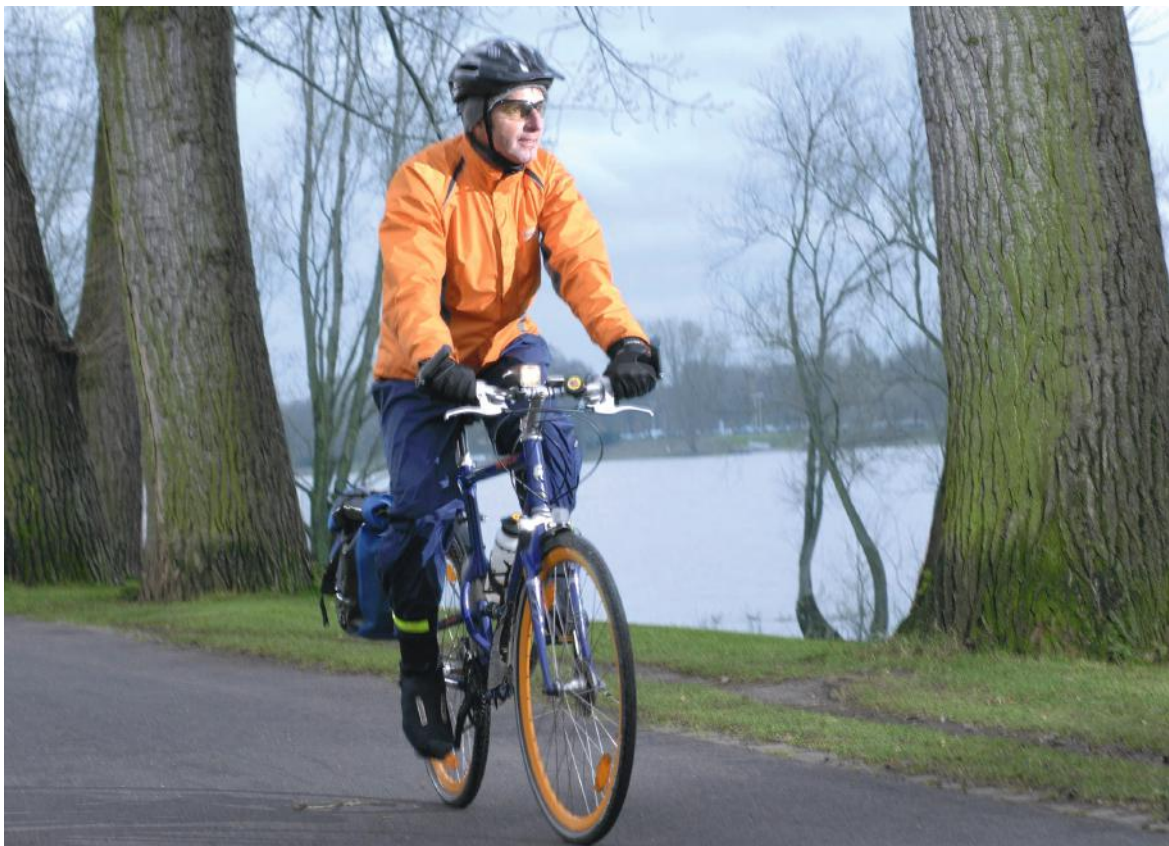
Abb. 01: Das Rad ist ein sehr beliebtes Verkehrsmittel.

In der kommunalen Verkehrsplanung findet das Verkehrsmittel Fahrrad daher zunehmend Berücksichtigung. Radwege in Städten und vermehrt auch zwischen Ortschaften im ländlichen Bereich werden neu angelegt oder ausgebaut, ebenso wie Radfahrstreifen in den Innenstädten.