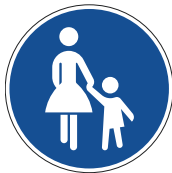
Zeichen 239 „Gehweg“

Ersteres ist an Radfahrende selbst adressiert und steht oft an stark befahrenen Straßen, die für Radfahrende zu gefährlich wären. Das andere ist ein Gefahrzeichen. Adressaten sind hier für gewöhnlich Kraftfahrerinnen und Kraftfahrer, die vor dem Auftreten von Radfahrenden gewarnt werden sollen.