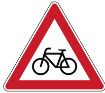
Zeichen 138 „Radverkehr“

Ersteres ist an Radfahrende selbst adressiert und steht oft an stark befahrenen Straßen, die für Radfahrende zu gefährlich wären. Das andere ist ein Gefahrzeichen. Adressaten sind hier für gewöhnlich Kraftfahrerinnen und Kraftfahrer, die vor dem Auftreten von Radfahrenden gewarnt werden sollen.