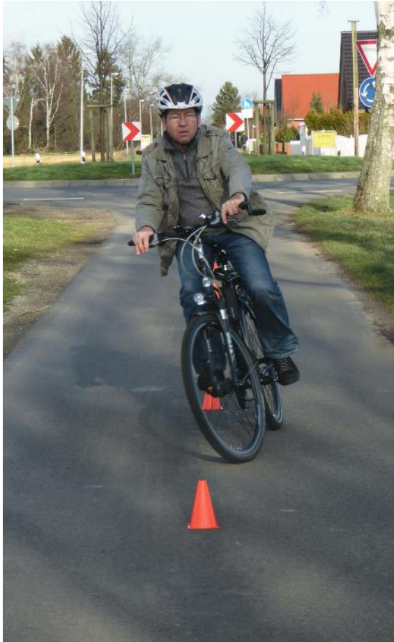
Abb. 22: Slalom fahren