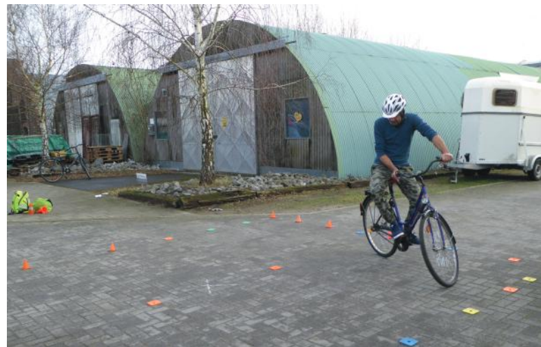
Abb. 25: Zusatzübung ACHT

telinie stehen bleiben. Sie sollen unbedingt vorsichtig und dosiert bremsen . Die Art und Stärke dieser Bremsung muss zuvor von Ihnen definiert werden und erfordert exakte Instruktion. Behalten Sie dabei stets die Sicherheit der Teilnehmenden als oberstes Ziel im Auge. Sie sollen zwar lernen, gut zu bremsen – aber nicht um den Preis eines Sturzes im Training. Vermeiden Sie alles, was zu einem Vorführeffekt beitragen könnte. Es geht nicht darum, Fähigkeiten vor anderen zu demonstrieren und möglichst alles auf der Bremse zu geben. Bei jedem Stopp am Bremspunkt geben Sie eine individuelle Rückmeldung und fragen, welcher Hebel auf welche Bremse wirkt. Auch wenn es Ihnen albern vorkommt – lassen Sie es sich nicht nur sagen, sondern auch zeigen.