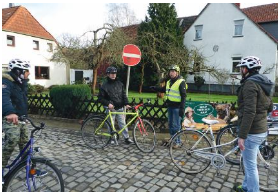
Abb. 28-29: Erprobungsfahrt im Realverkehr

Fahren Sie nun die Tour wie zuvor beschrieben. Sie fahren vor und führen die Gruppe. Hilfreich wäre es, wenn Sie noch eine Kollegin oder einen Kollegen zur Unterstützung hätten, um das sichernde Schlusslicht zu bilden.