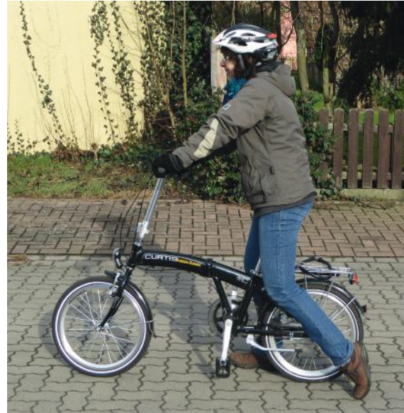
Abb. 17: Rollern mit dem Fahrrad

Die Teilnehmenden sollten nun erfahren haben, dass das einspurige Gefährt Fahrrad mit zunehmender Geschwindigkeit eine Stabilität entwickelt und sie keine Angst vor dem Umfallen haben müssen. Lassen Sie diesen Schritt solange üben, bis sich bei den Einzelnen eine Sicherheit bei diesem Bewegungsablauf einstellt. Sie sollten danach in der Lage sein, im nächsten Schritt selbst anzufahren und die Fortbewegung durch Treten der Pedale zu erreichen.