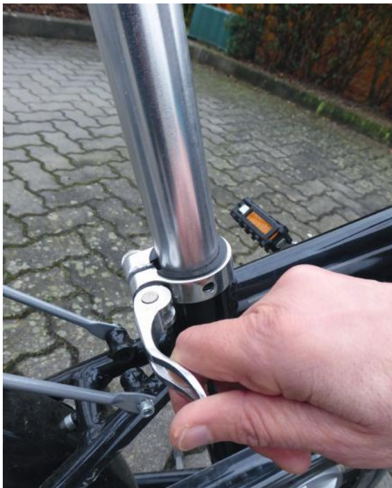
Abb. 11: Sattelhöhe einstellen

Wichtig ist auch, dass die Bremshebel in einem angemessenen Winkel zu Unterarm und Hand stehen. Beim Bremsen darf der Hebel nicht zu stark nach unten gedreht sein, denn ein Umgreifen kostet Zeit und kann in diesem Falle eine evtl. Überschlagsneigung begünstigen. Ist der Hebel zu stark nach oben gerichtet, kostet es ebenfalls unnötig Zeit und kann im Falle eines Aufpralls einen Bruch des Handgelenks begünstigen. Die Hebel sind dann korrekt eingestellt, wenn die Hände in Verlängerung der Unterarme gerade aufliegen.