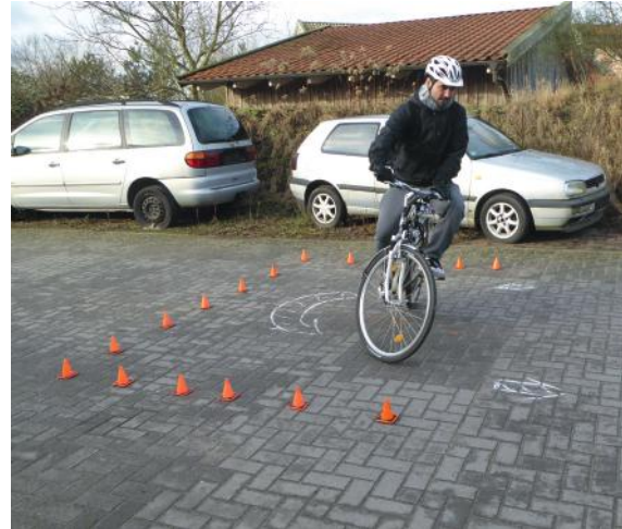
Abb. 23: Wenden ohne Handzeichen

Soweit dieser Schritt beherrscht wird, lassen Sie während der Wende zusätzlich das Handzeichen zum Abbiegen gehen. Verzichten Sie auf diese Aufgabe bei Teilnehmenden, die trotz Übung noch einen wackeligen Eindruck machen.