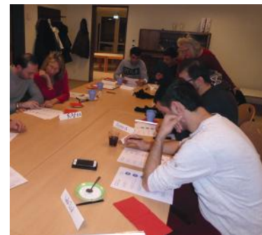
Abb. 03-05: Partner- und Einzelarbeit mit den Arbeitsblättern

Bitten Sie letztlich alle nochmals zu überprüfen, ob sie auf den Arbeitsblättern die richtigen Antworten gekennzeichnet haben. Sie sollen dann die Arbeitsblätter mit nach Hause nehmen, um sie dort am besten zusammen mit ihren Angehörigen nochmals durchzuschauen. Weisen Sie in diesem Zusammenhang auf das noch ausstehende Verkehrsquiz hin, in dessen Verlauf ihre Kenntnisse abgefragt werden.