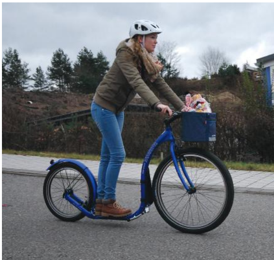
Abb. 14: Tretroller als Alltagsgefährt

Achten Sie bei der evtl. Auswahl von Rollern auf große Laufräder und ein möglichst breites Trittbrett. Stellen Sie die Lenkerhöhe entsprechend der Größe der jeweiligen Person ein. Beginnen Sie mit Balance-Übungen.