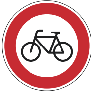
Zeichen 254 „Verbot für Radverkehr“