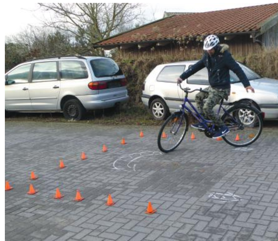
Abb. 24: Wenden mit Handzeichen