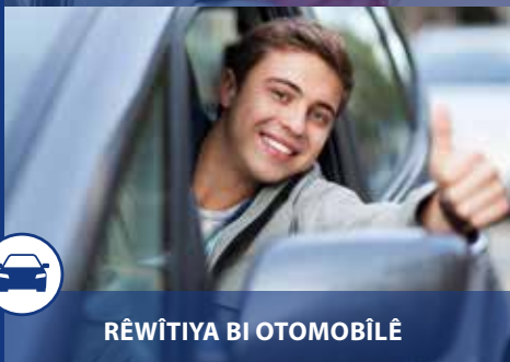
RÊWÎTIYA BI OTOMOBÎLÊ