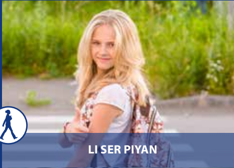
LI SER PIYAN