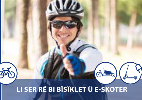
LI SER RÊ BI BÎSİKLET Û E-SKOTER