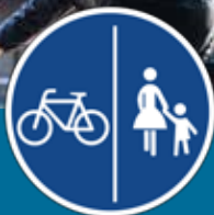
Piste cyclable à côté d'un trottoir