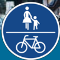
Voie commune pour les piétons et les cyclistes